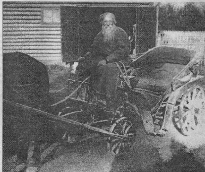
Извозчик. Фото начала XX века